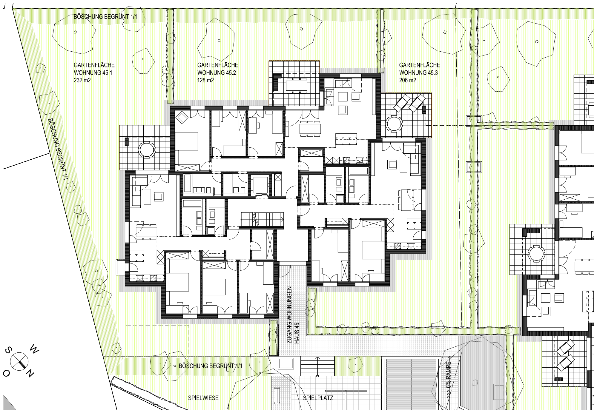
GRUNDRISS ERDGESCHOSS MIT UMGEBUNG HAUS 45 MST. 1:200