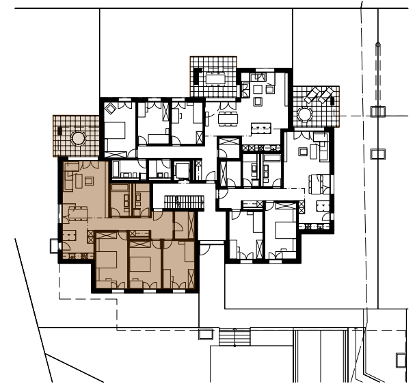
ÜBERSICHT EG HAUS BAHNHOFSTRASSE 45 MST. 1:500