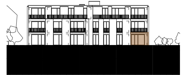
ANSICHT SÜDWEST HAUS BAHNHOFSTRASSE 45 MST. 1:500