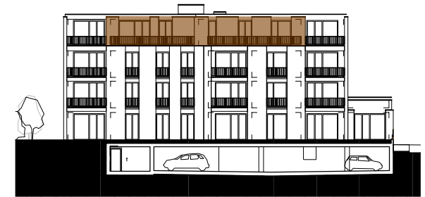
ANSICHT SÜDOST HAUS BAHNHOFSTRASSE 43 MST. 1:500