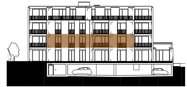
ANSICHT SÜDOST HAUS BAHNHOFSTRASSE 43 MST. 1:500