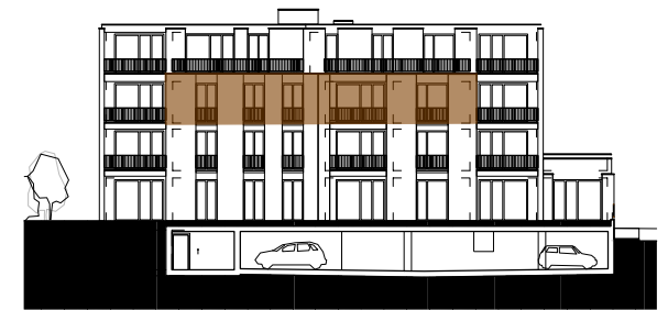
ANSICHT SÜDOST HAUS BAHNHOFSTRASSE 43 MST. 1:500