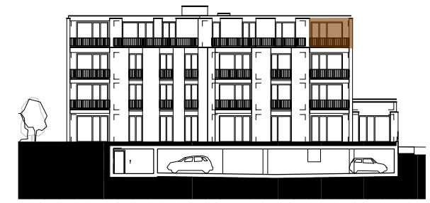
ANSICHT SÜDOST HAUS BAHNHOFSTRASSE 43 MST. 1:500