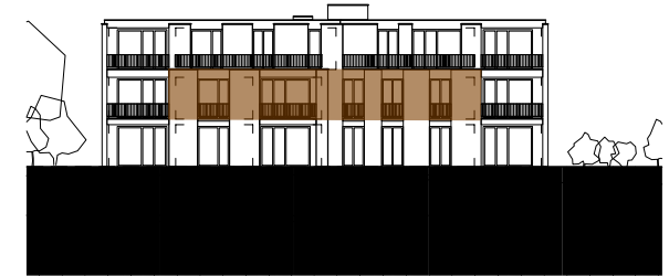
ANSICHT SÜDWEST HAUS BAHNHOFSTRASSE 45 MST. 1:500