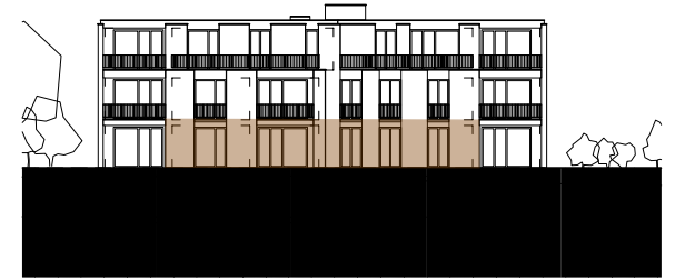
ANSICHT SÜDWEST HAUS BAHNHOFSTRASSE 43 MST. 1:500