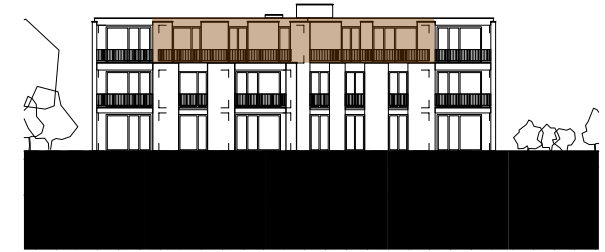
ANSICHT SÜDWEST HAUS BAHNHOFSTRASSE 45 MST. 1:500